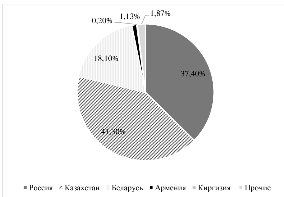
Рисунок 3. Структура текущего инвестиционного портфеля ЕАБР на 01.08.2017, % Источник: [6, с. 14]

Большинство проектов направлено на развитие инфраструктуры: производств с высокой добавленной стоимостью, энергетики, транспорта.