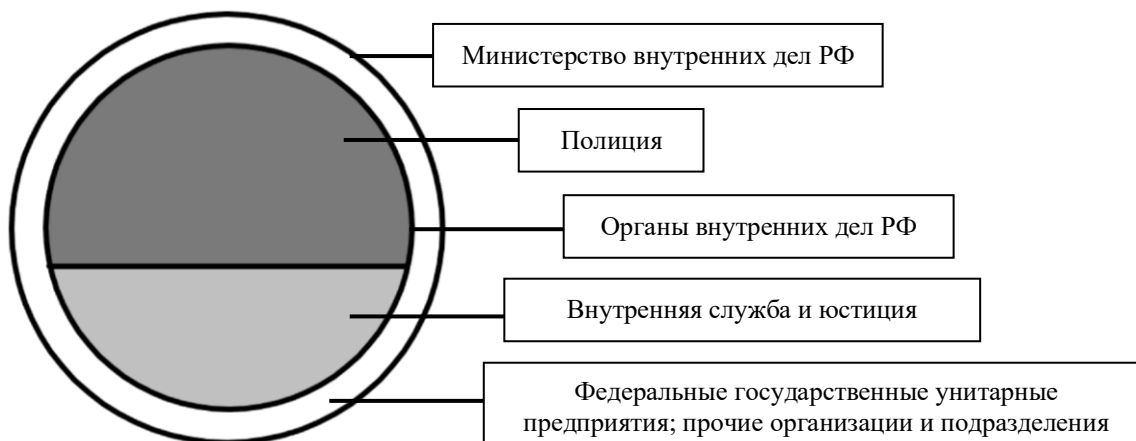
Рисунок 1 - Структура единой централизованной системы МВД России

пункт 13]. Следовательно, можно резюмировать, что оплата службы работников ОВД выступает существенным средством регулирования как деятельности правоохранительных органов, так и каждого конкретного сотрудника в рамках этой системы.